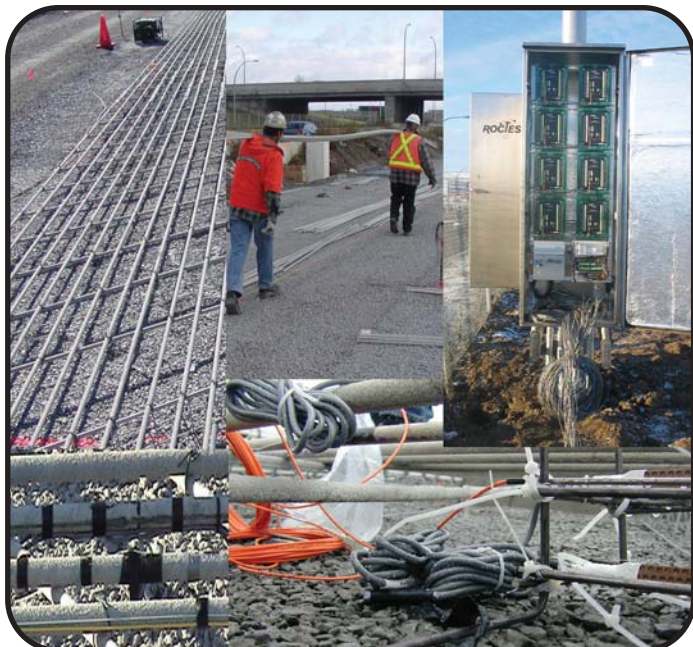
Photos de l'Autoroute 40, à Montréal, pendant la construction

elles intègrent les corps de connaissances et d'habiletés, les savoirs comportementaux, le développement des aptitudes et autres objectifs. L'intégration des nouvelles techniques utilisant les PRF et le monitoring dans le cursus canadien, par le biais des Modules pédagogiques conçus par ISIS Canada, remporte aussi un vif succès qui fut d'ailleurs souligné par la délégation canadienne.