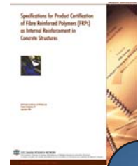
Homologation de produits d'ISIS